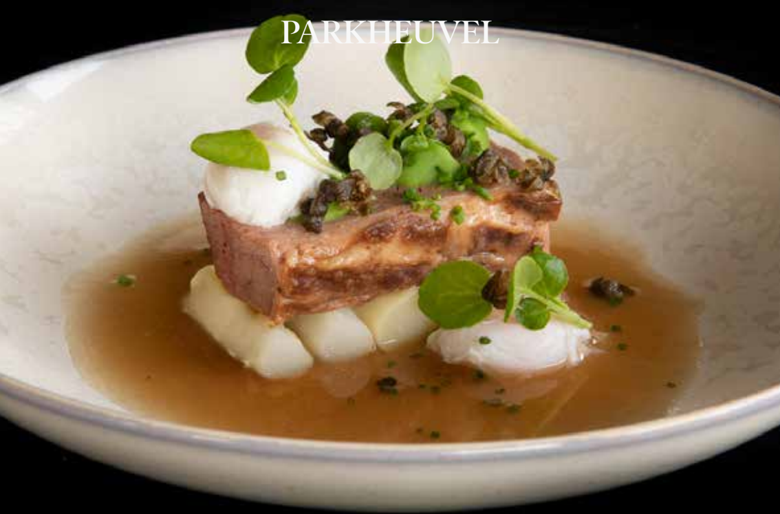
Black Angus brisket