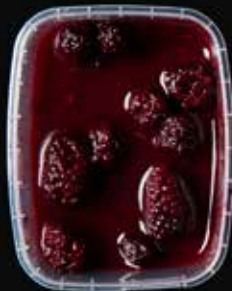
Bramen in sap