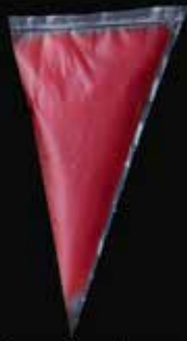
Gel van framboos