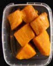
Gepofte zoete aardappel