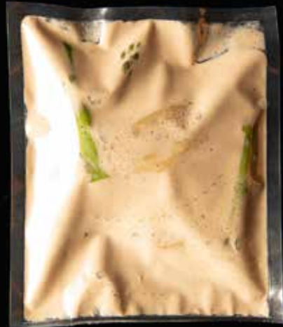
Ravioli, asperge, champignon-truffelsaus