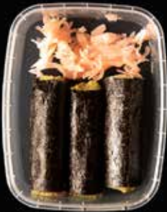
Hamachi, zoetzure gember