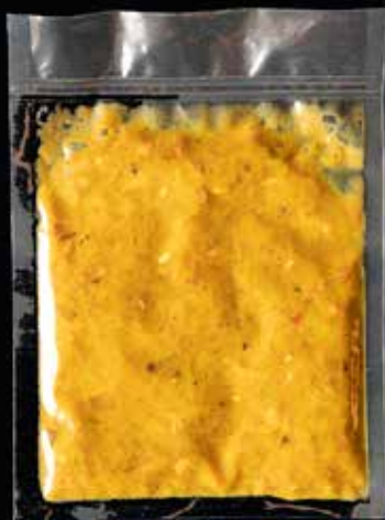
Spitskool met spek