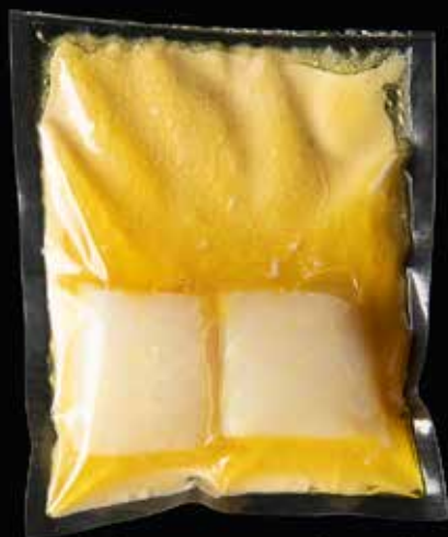
Kabeljauw, verjus, vaudovainolie