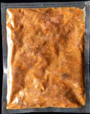
Stoof van ree