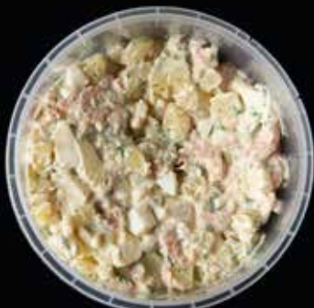
Aardappel, ei, garnalen