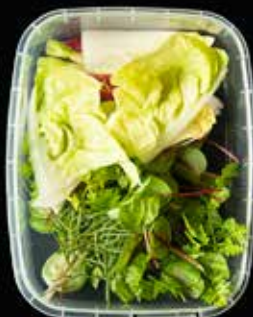
Sla en kruiden