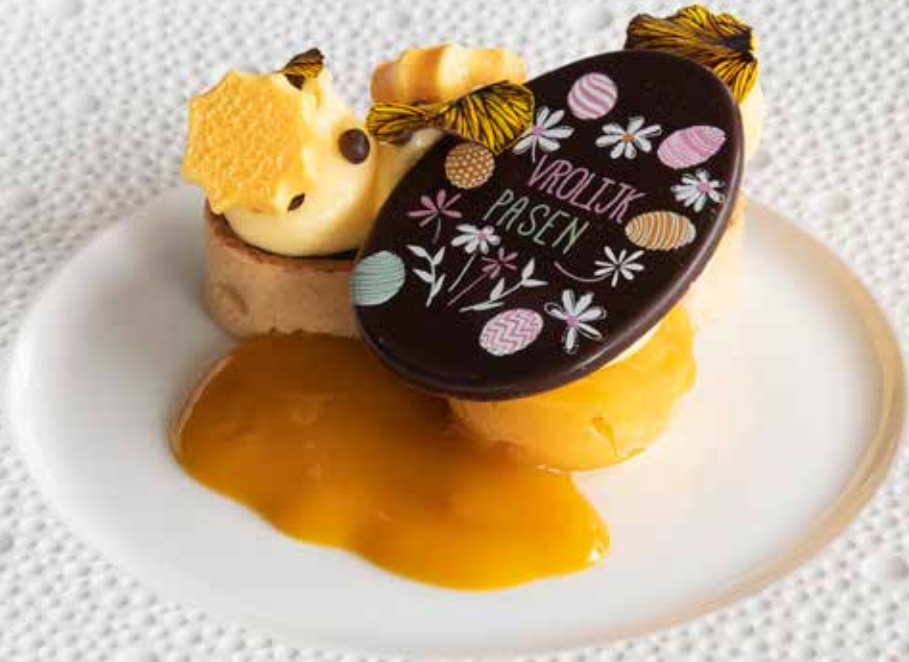
Paas ei/chocolade kogels